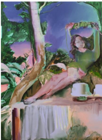
Yuhao Chen, A Little More , 2025, Acryl auf Leinwand, 190 x 140 x 2,5 cm