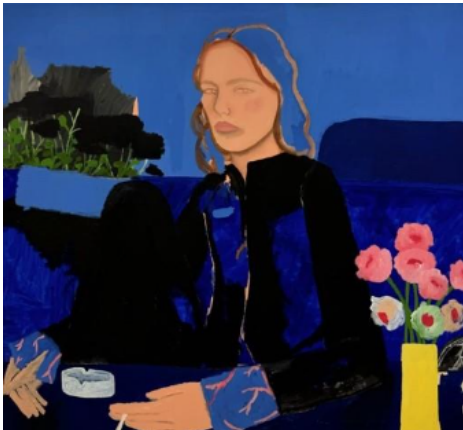
Lunita July Dorn, Heute für immer , 2024, Acryl auf Leinwand, 125 × 135 cm