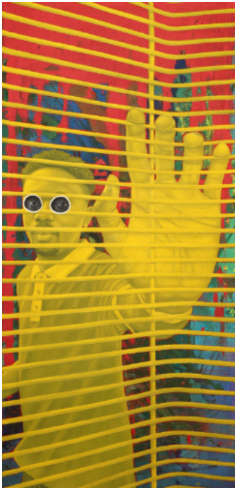
Ken Nwadiogbu, The Line Between You and Me , 2025, Oil and Acrylic on Akwete Handwoven Fabric, 170 x 80 cm