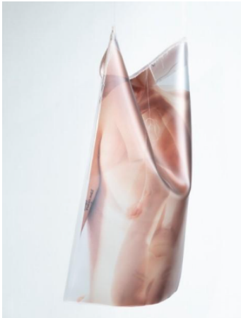
Arne Grashoff, Between us, only skin , 2024, UV-Direktdruck, weich PVC, Garn, 110 × 80 × 20 cm

Eine Initiative von Degussa Goldhandel mit Monopol