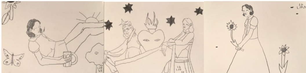
Zeichnungen 1 – 3