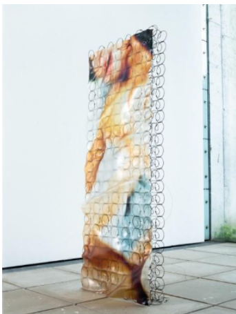
Arne Grashoff, Stripped , 2024, C-41 Fotografie, UV-Direktdruck, hart PVC, Springfederkern (Metall), Metall-Draht, 180 × 70 × 25 cm