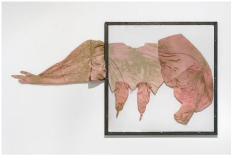
Emmélie Lempert, Ohne Titel (longing desperately) , 2025, Baumwolle, Satin, Polyestergergarn, Ösen, Stahlwinkelprofile, Polycarbonat, 66 x 120 cm