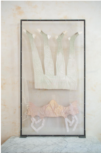
Emmélie Lempert, Ohne Titel (floating) , 2025, Baumwolle, Satin, Polyestergerarn, Ösen, Baumwollbänder, Erde, Stahlwinkelprofile, Polycarbonat, 180 x 100 cm

Eine Initiative von Degussa Goldhandel mit Monopol