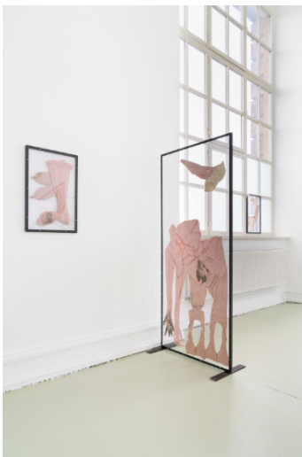
Emmélie Lempert, seek, arms, seek , 2024, Viskosejersey, Polyestergergarn, Erde, Stahlwinkelprofile, Polycarbonat, 198 x 86 cm