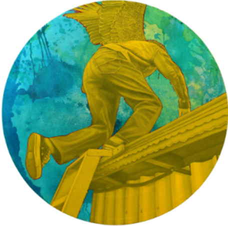
Ken Nwadiogbu, Take Off , 2025, Oil and Acrylic on Akwete Handwoven Fabric, 75 ø