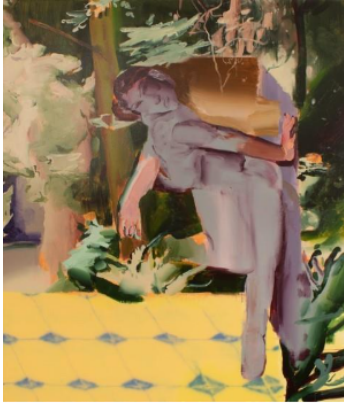
Yuhao Chen, Veiled Araucaria , 2024, Acryl auf Leinwand, 140 x 120 x 2,5 cm

Eine Initiative von Degussa Goldhandel mit Monopol