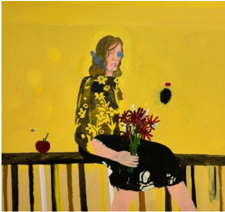
Lunita July Dorn, Wenn genug Zeit vergangen, merkst du, dass die Welt sich weitergedreht hat , 2025, Acryl auf Leinwand, 170 × 180 cm

Eine Initiative von Degussa Goldhandel mit Monopol