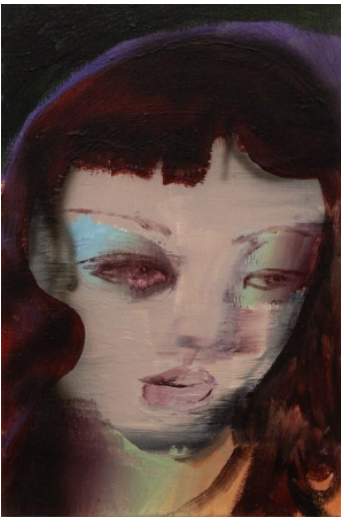
Yuhao Chen, “Zara Moonfall” , 2025, Acryl auf Leinwand, 30 x 20 x 2,5 cm